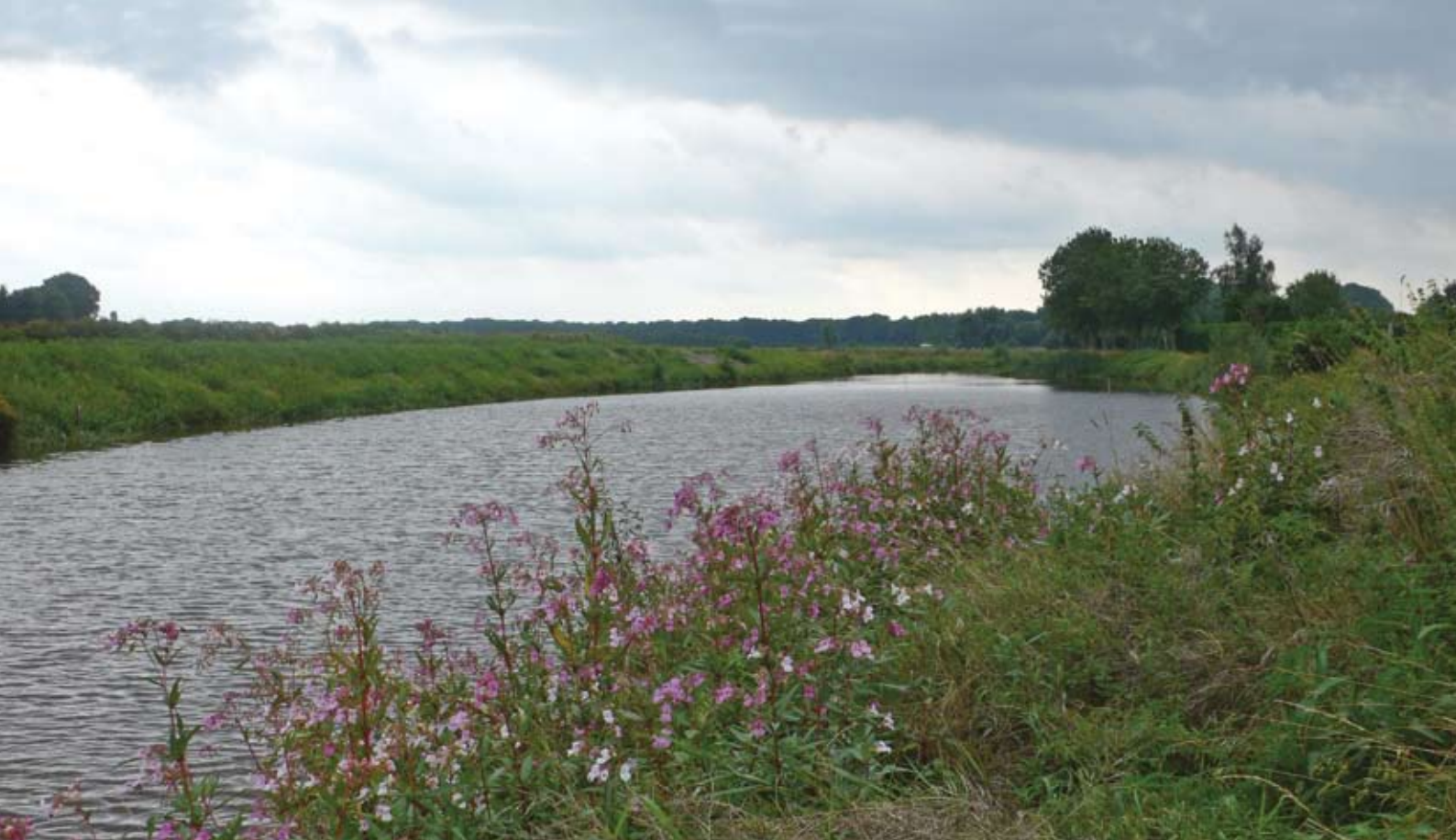
De rivier de Mark als grens tussen België en Nederland