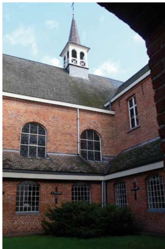
Klooster van Meersel-Dreef