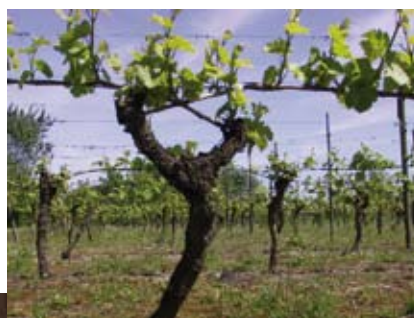
Wijngoed Domaine D' Heerstaayen