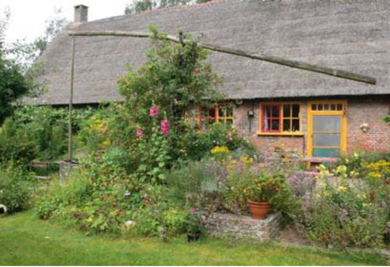
Langgevel boerderij met waterput