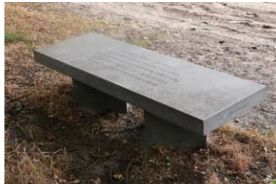
Poëziebank met tekst van Y. Né bij Strijbeek

Langs het zandpad ligt een poosplaats met het gedicht dat Y. Né voor deze plek schreef.