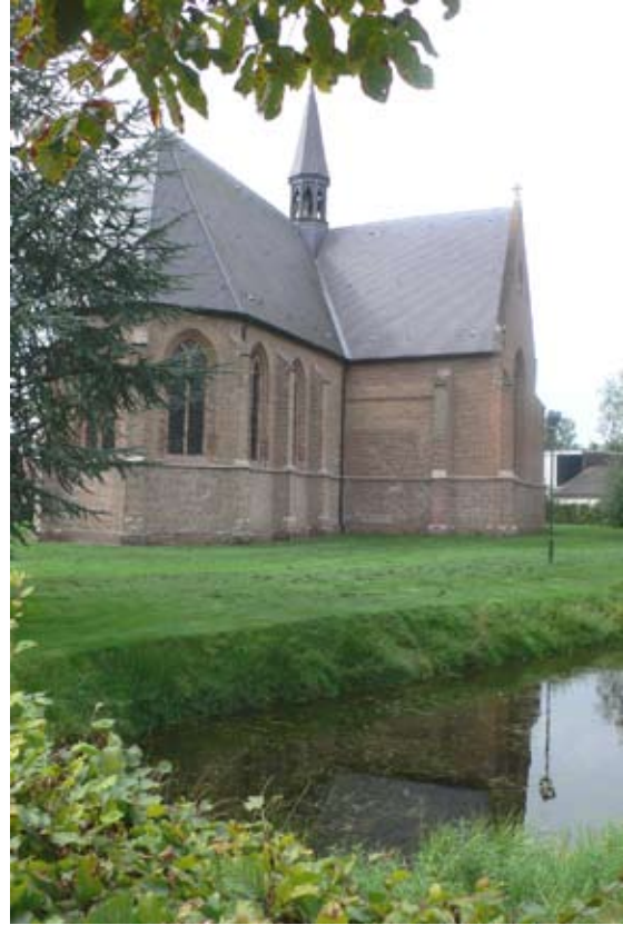
De Ledevaertkerk aan een van de oude visvijvers langs de Dorpsstraat van Chaam

De plaatsnaam Chaam hangt samen met het Keltische woord 'camb' dat kromming in een waterloop betekent. Aangenomen wordt dat hier tot vroeg in onze jaartelling één van de Keltische talen werd gesproken.