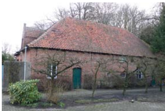
Oudste gedeelte van het klooster