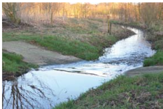
Voorde in de Kerselsche Beek