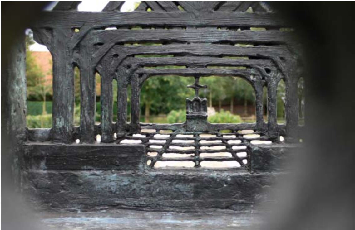
Perspectiefkijker van Ruud Ringers bij de fundamenten van schuurkerk De Pelicaen