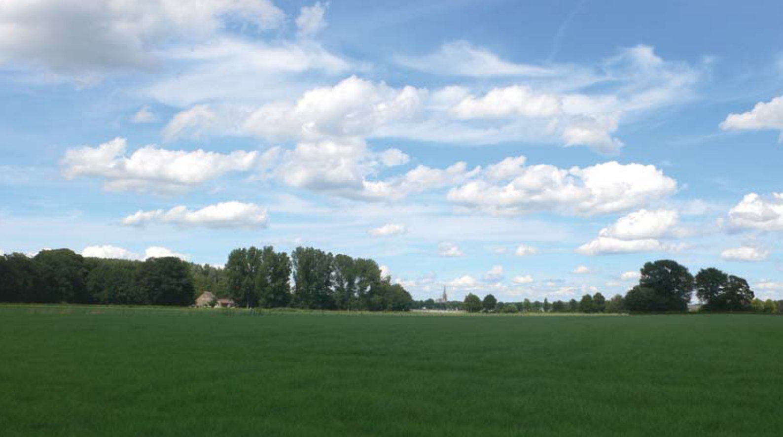
Hoeve de Blauwe Kamer, in de verte de toren van Ulvenhout