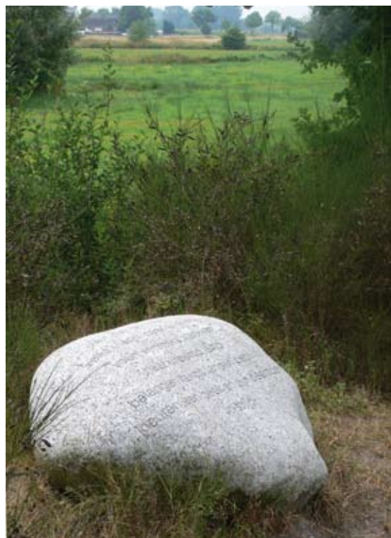
Dichtsteen van Pien aan de rand van bij het voormalig slagveld bij Strijbeek

Deze plek nabij de Strijbeekse Beek, die eeuwenlang een natuurlijke grens vormde, bleek niet alleen voor Napoleon, maar ook tijdens de Tiendaagse Veldtocht en in de